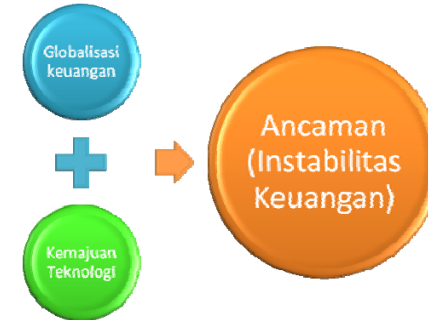
Gambar 1. Ilustrasi pengaruh globalisasi keuangan dan kemajuan teknologi terhadap ancaman instabilitas keuangan

Dalam mendukung analisis terhadap pengaruh dua variabel utama, “globalisasi keuangan” dan “kemajuan teknologi”, terhadap instabilitas keuangan domestik seperti yang diilustrasikan pada art chart dibawah ini, penulis melakukan investigasi terhadap literatur-literatur yang relevan yang berposisi “pro” maupun “kontra” terhadap hipotesis tersebut. Sumber-sumber/data-data penting yang disurvei dalam penelitian antara lain berasal dari: Bank Indonesia ( www.bi.go.id ), Bank of International Settlement ( www.bis.org ) dan Bank Dunia ( www.worldbank.org ). selanjutnya, dalam survey literatur yang dilakukan, pencarian literatur dan publikasi yang relevan dilakukan dengan search engine akademis terkemuka, yaitu: google scholar dan science direct .